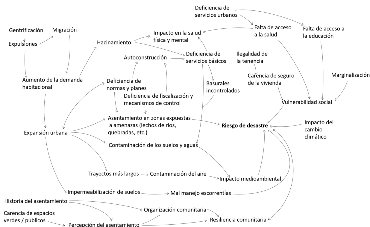
Figura 3. Dimensiones de la precariedad urbana y riesgo de desastre

Finalmente, se desarrolló un mapa conceptual de las dimensiones de la precariedad urbana considerando sus relaciones con el riesgo de desastres, ilustrado en la Figura 3. Esta figura refleja la complejidad de las vinculaciones entre diferentes procesos de precariedad urbana y riesgo de desastre, y lleva a interrogar sobre como los modelos de precariedad pueden integrar transversalmente una perspectiva de riesgo.