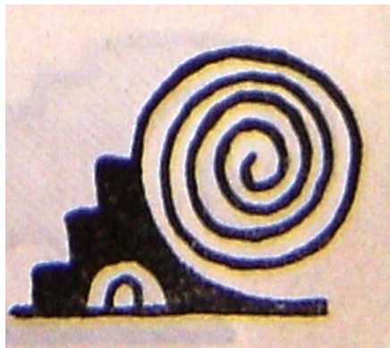
Figura 1. Símbolo espiral del huracán

Según Ortiz, el remolino aéreo de la tromba, y el tornado fueron el origen del símbolo prototípico de la espiral, y luego por analogías morfológicas, la sigma, la onda, la nube, la lluvia, la serpiente, y todos los fenómenos naturales relacionados significaron lo mismo: el remolino aéreo y acuático de la tromba, el tornado, el huracán y la nube tempestuosa y portadora de lluvias (ver Figura 1).